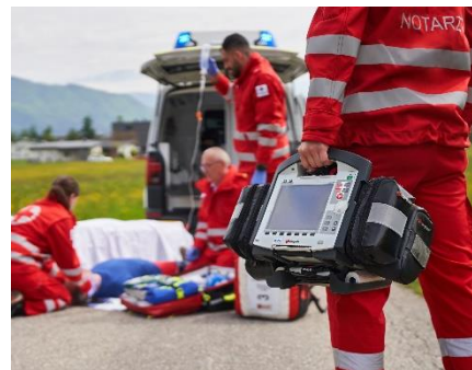
Foto: Allein im Rettungsdienst leisten die Freiwilligen um die 190.000 Stunden im Jahr.