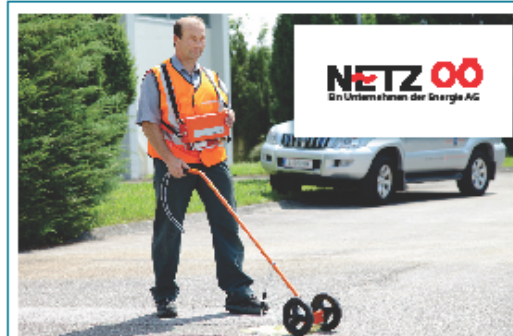
Im Zuge der routinemäßigen Wartung des Gasnetzes wird die Leitungstrasse mit einem Gasspürgerät abgegangen und auf Funktionstüchtigkeit geprüft.

Blinden- und Sehbehindertenverband OÖ 4020 Linz, Makartstr. 11 Tel.: 0732 652296-0 office@blindenverband-ooe.at www.blindenverband-ooe.at